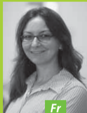
Fr Heide Depner Hohenstein Textile Testing Institute