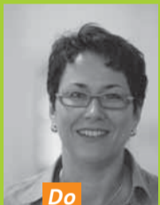
Do Anke Rühl Hohenstein Textile Testing Institute