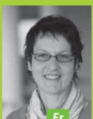
Fr Sigrid Vette Hohenstein Textile Testing Institute