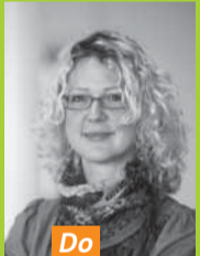
Do Nadine Mallok Hohenstein Textile Testing Institute