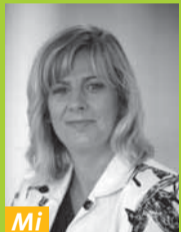
Mi Rose-Marie Riedl Pressestelle Hohenstein Institute