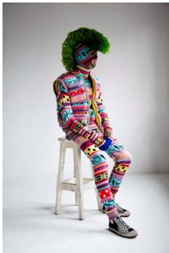
„Knitmonster“ SIBLING

Der Auftakt zur Campaign for Wool lag 2011 in Australien. Aufwändige Inszenierungen, eine Modenschau mit internationalen und lokalen Top-Designern – darunter Missoni, Mark Fast, Richard Nicoll, Thom Browne, E. Tautz by Patrick Grant und Tom Scott - unterstrichen die herausragende Kreativität von Woll-Kreationen.