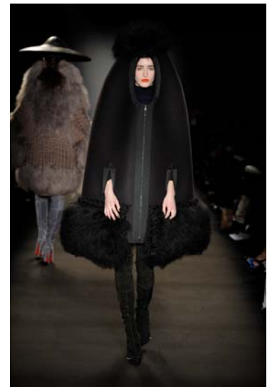
Giles Deacon "The Egg Twin"