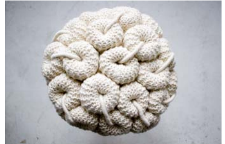
© Campaign for Wool; Claire Anne O'Brian

WOOL MODERN fokussiert den modernen, innovativen und avantgardistischen Ein-