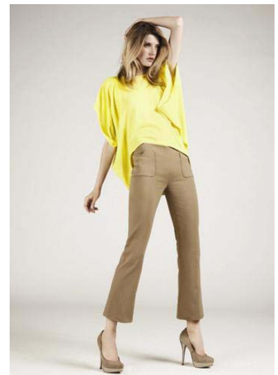
© MAC Mode GmbH & Co KgaA

Die modische Hose im Frühjahr/Sommer 2012 ist körpernah und gerade gearbeitet. Trendig sind verkürzte Längen, egal ob Capri, Bermuda oder die neue City-Shorts. Boot Cuts mit Schlag und erhöhter Taille sind für den 70er-Jahre Look unverzichtbar. Als modischer Geheimtipp gelten verkürzte Formen mit leichtem Schlag, die für mehr Weite ab Wade sorgen. Chinos bleiben ein starkes Thema und finden sich mit oder ohne Bundfalte in den Kollektionen. Weil in der neuen Saison Farben dominieren, werden auffällige Details an der Ware zurück genommen. Hochwertige Knöpfe, edle Druckknöpfe, glänzende Metallzipper, schöne Innenverarbeitungen und dezente Stickereien sind aber weiterhin ein unverzichtbares Muss. Bei den Materialien wird der cleane Look stärker. Neu sind fließende Baumwoll-Mischungen, die die feminine Ausstrahlung der Trägerin betonen.